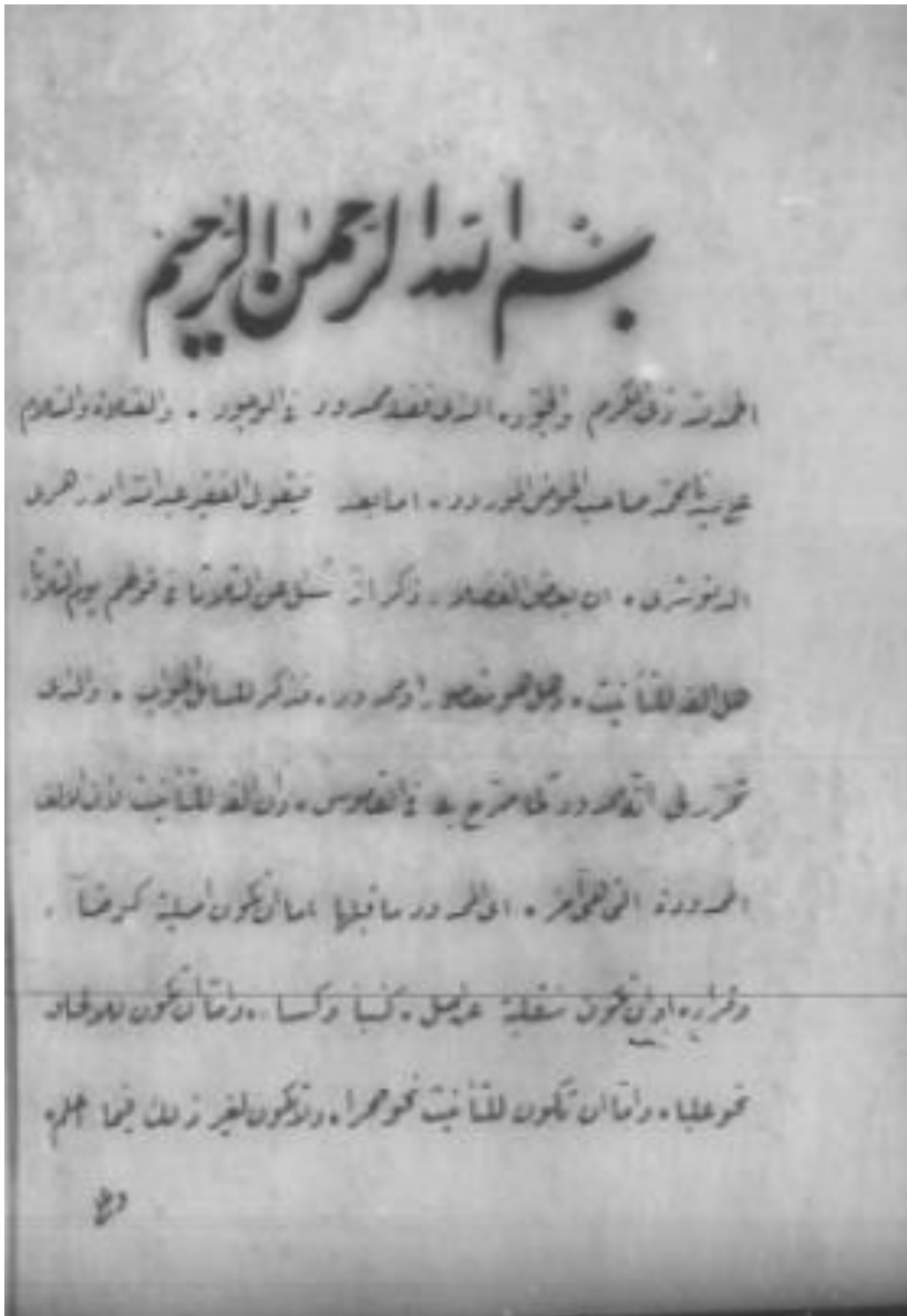
صورة الصفحة الأخيرة